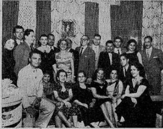
Grupo de asistentes al Homaje ofrecido a nuestra Directora en Nueva York