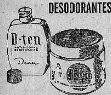
REGULA LA TRANSPIRACION DE LAS AXILAS Y LAS DESODORIZA POR VARIOS DIAS